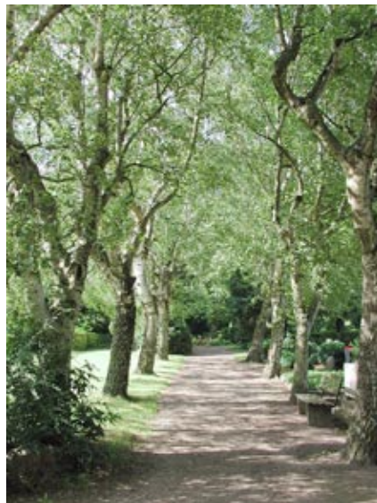
Weg auf dem Liemer Friedhof