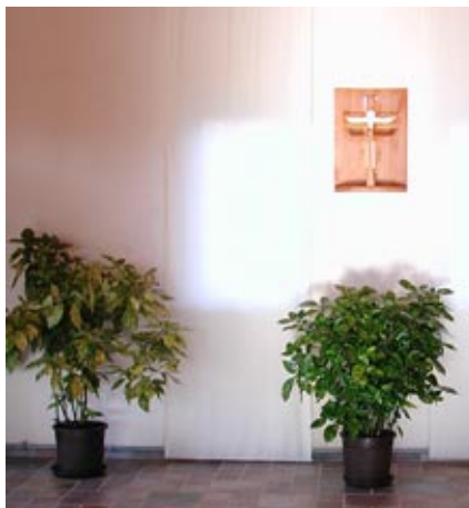
Friedhofskapelle in Lieme

Am Tag vor dem Ewigkeitssonntag wurde die renovierte Kapelle der Öffentlichkeit vorgestellt. Die richtigen Worte für die Einweihung zu finden, war uns wichtig. Wir wollten die Gemeinde in würdevoller Weise mit der Umgestaltung vertraut machen. Die Presse hat es gehört: „Die Friedhofskapelle, ein Ort, den man nur im Ausnahmefall betritt: der Tod. Ein Ort, der düster, kühl und befremdlich wirkt? Ein Klischee, dass die Kirchengemeinde Lieme erfolgreich veränderte.“