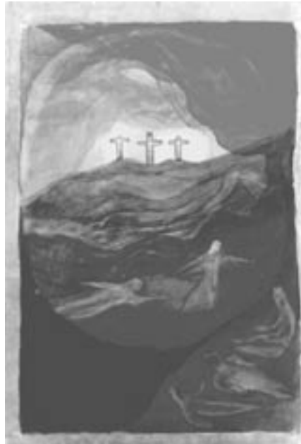
Ostern: Fest der Auferstehung