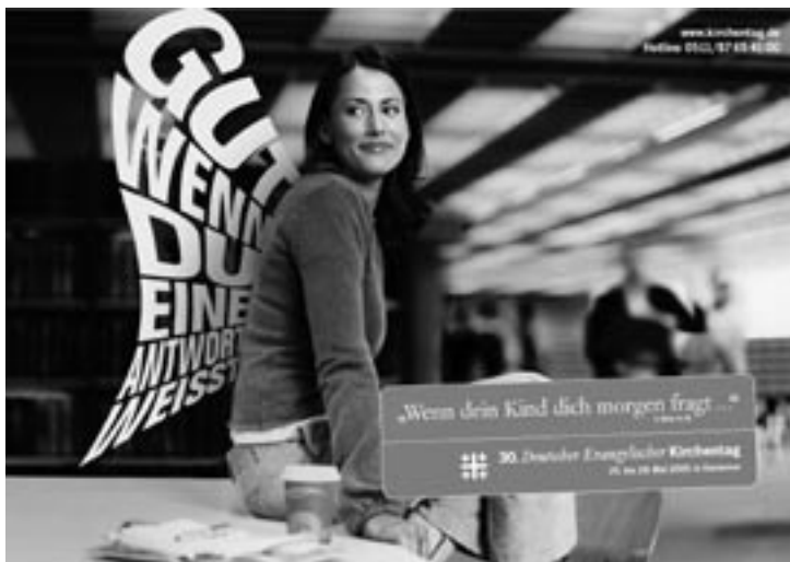
Offizielles Plakat des Dt. Ev. Kirchentages in Hannover

Seit mehr als 20 Jahren sind der Einladung jeweils über 100.000 Menschen gefolgt. Zum großen Teil sind die Besucherinnen und Besucher jünger als 30 Jahre, viele darunter Schüler, Schülerinnen und Studierende. Etwa die Hälfte kommt jeweils zum ersten Mal, für die übrigen ist es bereits ihr zweiter, dritter oder vierter Kirchentag.