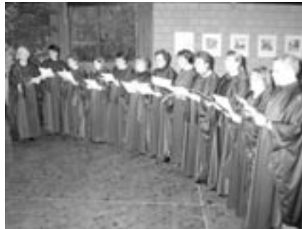
Der Chor in Kutte