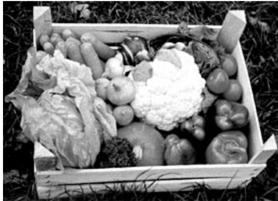
„Traumernte“ eines Hobbygärtners