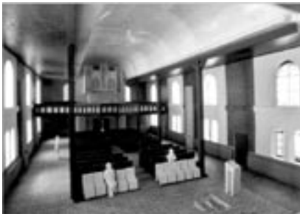
Modellentwürfe der FH Lippe