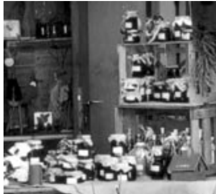
Bratapfel- marmelade und Glühweingelee - einfach lecker!

Viel Spaß beim Stöbern und guten Appetit!