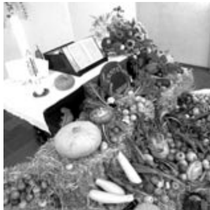
Die Erntegaben in der Liemer Kirche, Fred Niemeyer