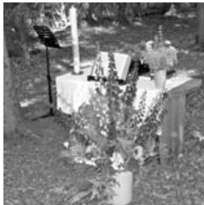
Blick in die Waldkirche im Rhien: Herbert Kleine- Ostmann